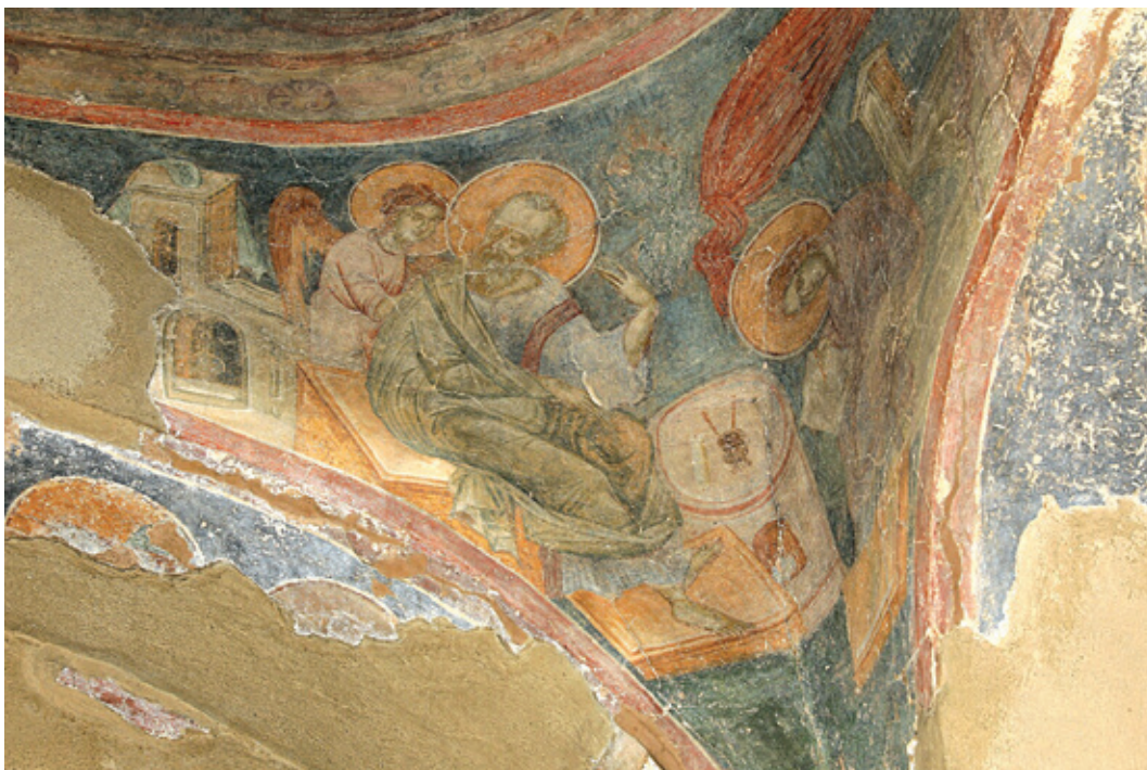
Сл. 4. Јеванђелиста Јован , Јошаница

Јошанице (Сл. 4), настао око 1435. године. Једино ту су, како се чини, женским фигурама иза јеванђелиста насликана крила, попут Премудрости у пандантифима Богородице Одигитрије у Пећи. 10 У Јошаници је Јован Богослов приказан у седећем положају, главом окренут ка фигури анђела – божанској Премудрости, сличног решења као у Никодимовом четворојеванђељу. У односу на ту минијатуру, у оба примера из монументалног сликарства је приказан и млади Прохор, како записује речи Светог Јована. Код тих примера је и архитектонска кулиса другачије решена.