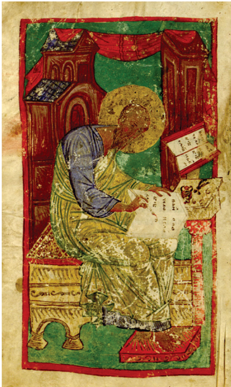
Сл. 6. Јеванђелиста Јован, Четворојеванђеље, НБС Рс 648, л. 170 v