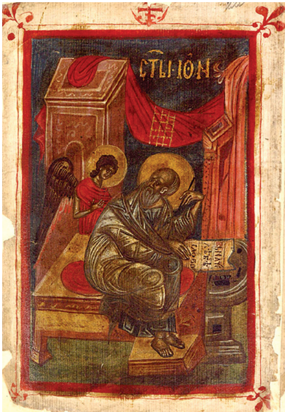
Сл. 2. Јеванђелиста Јован, Никодимово четворојеванђеље, НБКМ 41, л. 220