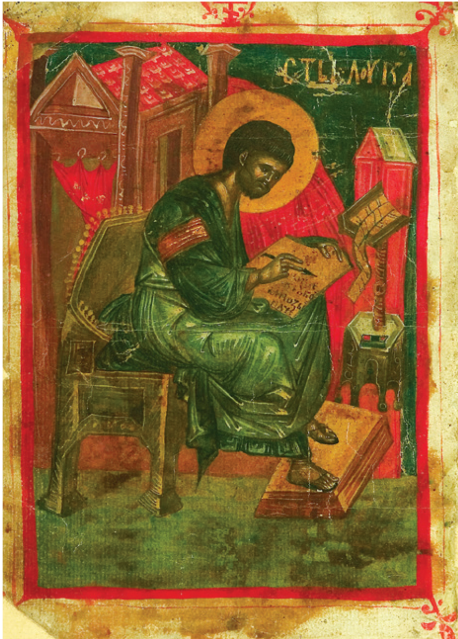
Сл. 1. Јеванђелиста Лука , Музеј примењене уметности у Београду (инв. бр. 1350)*