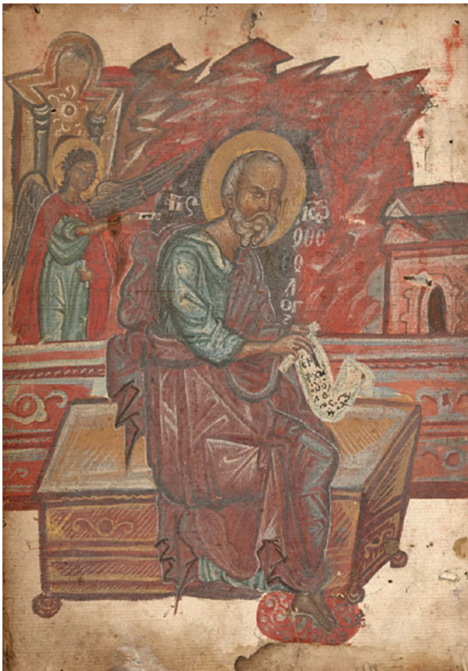
Сл. 3. Јеванђелиста Јован, British library Add MS 37008, л. 1 v